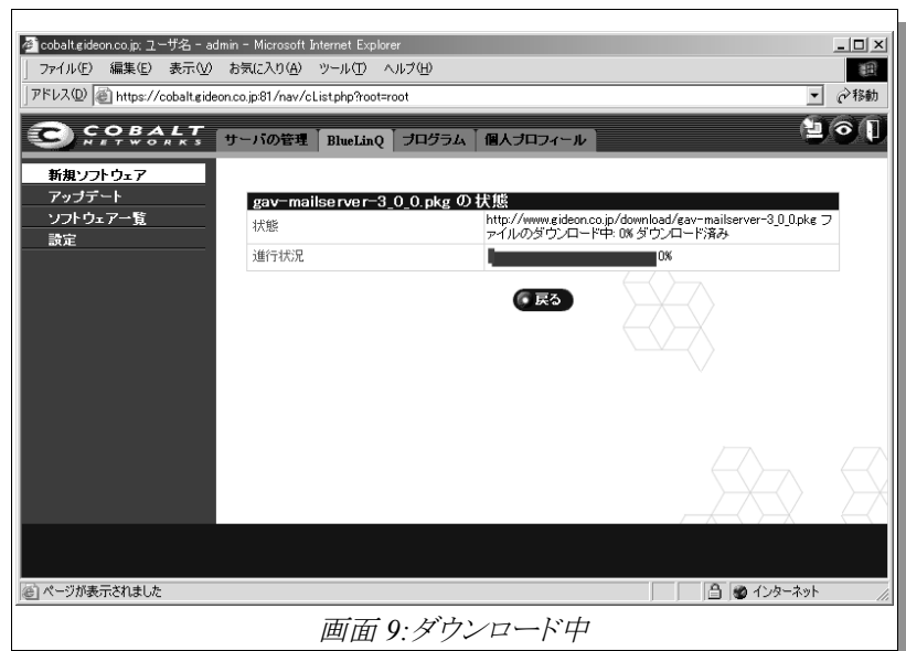
画面 9:ダウンロード中

入力が終了した後、『インストール準備を開始』ボタンを選択することにより、ダウンロードを開始します。ダウンロード中は、画面 9 のように表示されます。