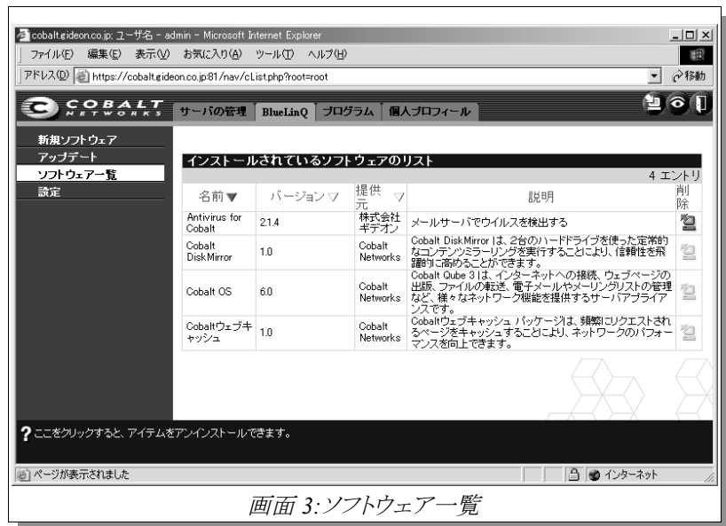
画面 3:ソフトウェア一覧

この『Antivirus for Cobalt』項目の右の削除を選択すると、画面 4 の