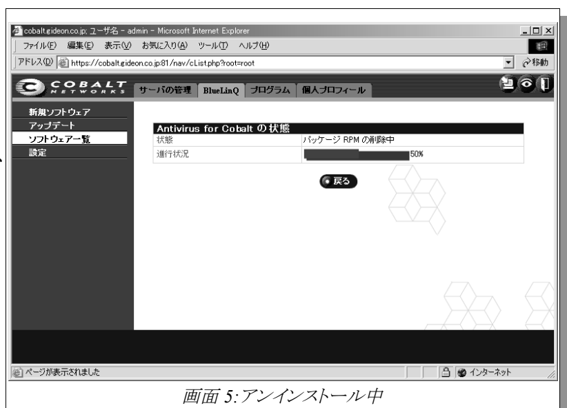
画面 5: アンインストール中

『アンチウイルス for SunCobalt』アンインストール中は、画面 5 のように表示されます。しばらくお待ちいただいた後、画面 6 が表示され、その後ログイン直後の画面が表示されれば、アンインストール作業は終了となります。