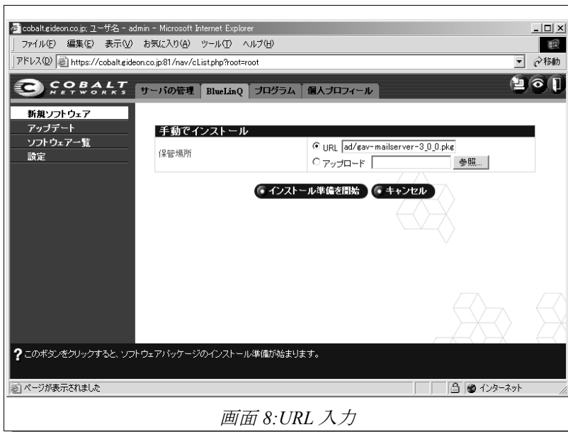
画面 8:URL 入力

http://www.gideon.co.jp/download/gav-mailserver-3_0_0.pkg